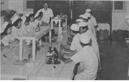
Phòng thí nghiệm ở Viện Pasteur Sài Gòn