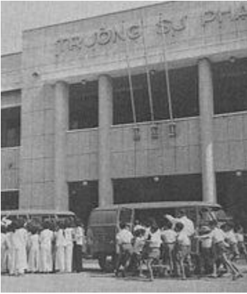
Trường Đại học Sư phạm thuộc Viện Đại học Sài Gòn

Trường Đại học Sư phạm Sài Gòn thuộc Viện Đại học Sài Gòn (thành lập vào năm 1957) là cơ sở sư phạm đầu tiên, bắt đầu khai giảng năm 1958. [81] Sau có thêm các trường cao đẳng sư phạm ở Ban Mê Thuột , Huế , Vĩnh Long , Long An , và Quy Nhơn [82] Nha Trang , Mỹ Tho , Cần Thơ , Long Xuyên . [83] Ngoài ra còn có Trường Đại học Sư phạm Huế thuộc Viện Đại học Huế và Trường Đại học Sư phạm Đà Lạt thuộc Viện Đại học Đà Lạt . [84] Vào thời điểm năm 1974, cả nước có 16 cơ sở đào tạo giáo viên tiểu học với chương trình hai năm còn gọi là chương trình sư phạm cấp tốc. Chương trình này nhận những ai đã đậu được bằng Trung học Đệ nhất cấp. [85] Hằng năm chương trình này đào tạo khoảng 2.000 giáo viên tiểu học. [86] Giáo viên trung học thì phải theo học chương trình của trường đại học sư phạm (2 hoặc 4 năm). [87] Sinh viên các trường sư phạm được cấp học bổng nếu ký hợp đồng 10 năm làm việc cho nhà nước ở các trường công lập sau khi tốt nghiệp. [88]