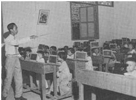
Một lớp tiểu học ở miền Nam vào năm 1961 .

Từ những nguyên tắc căn bản ở trên, chính quyền Việt Nam Cộng hòa đề ra những mục tiêu chính sau đây cho nền giáo dục của mình. Những mục tiêu này được đề ra là để nhằm trả lời cho câu hỏi: Sau khi nhận được sự giáo dục, những người đi học sẽ trở nên người như thế nào đối với cá nhân mình, đối với gia đình, quốc gia, xã hội, và nhân loại?